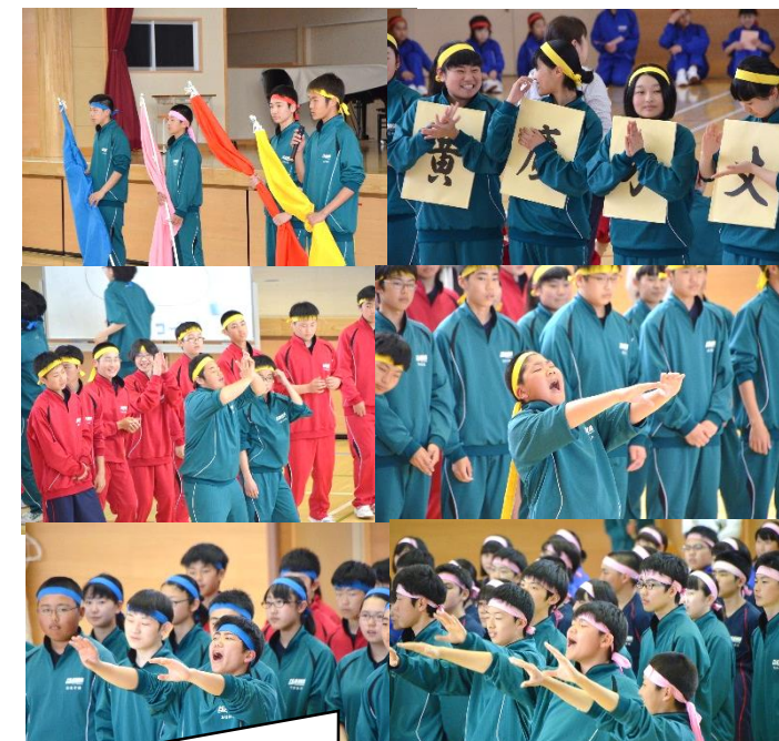
※徐々に緊張がとれ、秘めていた力が声や動きに乗り移っていく様子が伝わってきました。

4月25日(木)、組ごとに結団式が行われ、いよいよ体育祭に向けてムードが盛り上がってきました。リーダーとなる3年生は、そのかなり前から入念に準備を進めており、後は迷うことなく1,2年生を引っ張っていただけの状態となっています。胆沢プライド体育祭は、2,3年男子の徒競走が200mだったり、持久走があったりなど、かなり競技志向が強い内容になっています。その中では、応援と長縄跳びは組団の団結力が特に問われるところとなります。胆沢中学校1年生の私としては、体育祭も大変楽しみであり、生徒たちの新たな一面を引き出す好機となることを期待しているところです。よって、体育祭は私が始業式でお話した4つのCの中のChanceとChallengeの場となるのではないかと思います。長い連休をはさむこととなりますが、モチベーションをうまく保ち、連休明けから集中(Concentration)して取り組んでいくことができるよう、組団のリーダーの手腕に大いに期待したいと思います。