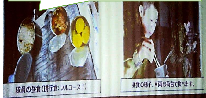
隊員の昼食(携行食:フルコース!)