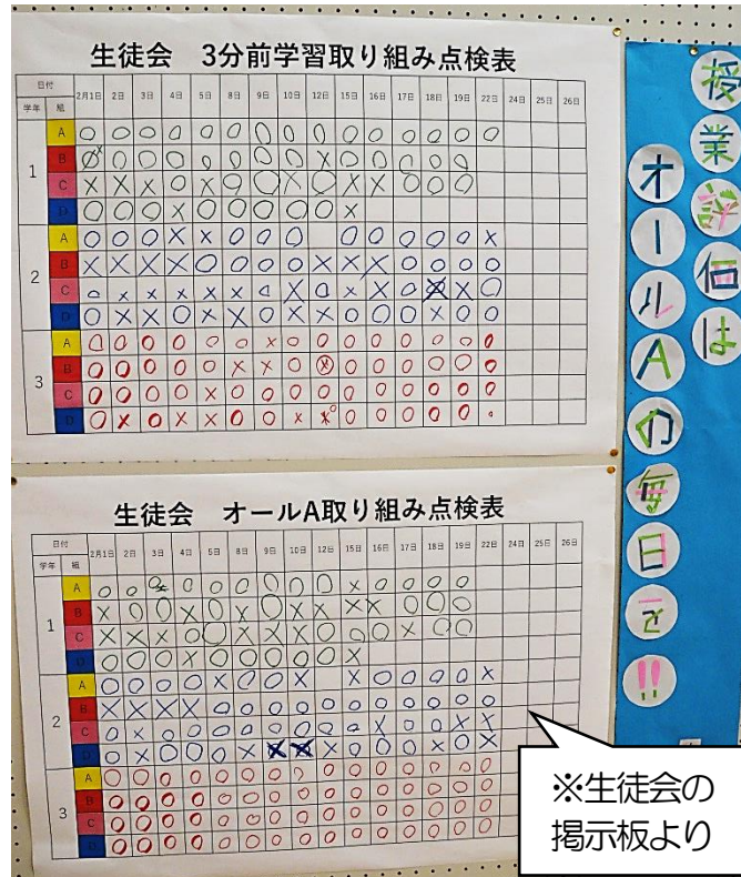
※生徒会の 掲示板より

なっていました。昨年度は40号で終わりだったので、今年度も同じく40号を発行したことになります。コロナ禍で生徒の活躍の場が減り、発行ペースも落とさざるを得ないと観念していたのですが、 こんな時だからこそ伝えたいことがたくさんあった ということに、今更ながらちょっとびっくりしているところです。