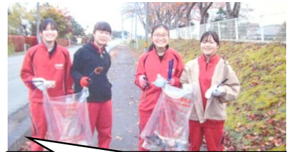
※胆沢 Jr リーダーズクラブの活動で、道路清掃に取り組んだ3年生の皆さんです。

「ボランティアを通して、地域に恩返しをしたい」と考えている生徒はたくさんいますが、こんな状況ですのになかなか機会がありません。それでも少しずつ